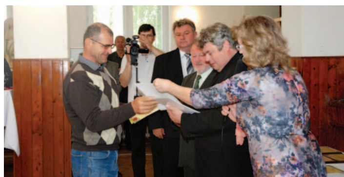
♦ Organizátori a porotcovia počas vyhodnocovania v plnej permanencii.