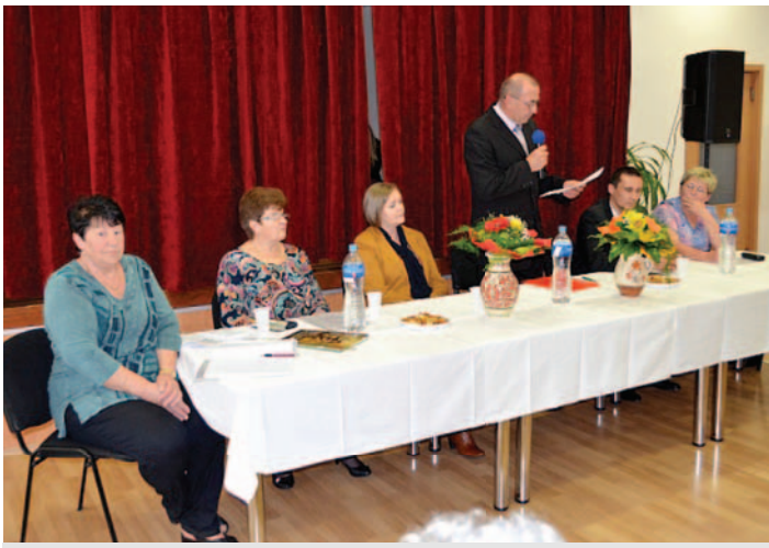
♣ Elnöki beszámoló