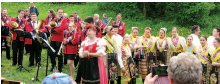
♦ Matičiarskí pútnici pokope v lone prírody