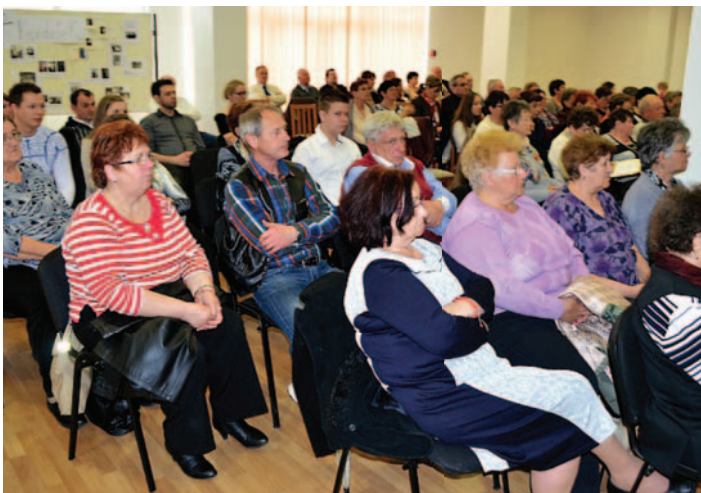
♣ A közönség