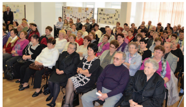
♣ Csemadok - tagság