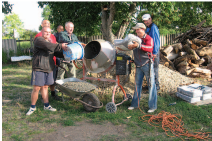
♦ Ak treba svoje úsilie vracajú v podobe práce svojim sponzorom

a oberajú hrozno. Chovanci sa aktívne zapájajú aj do rekonštrukčných prác v objekte a pomá-