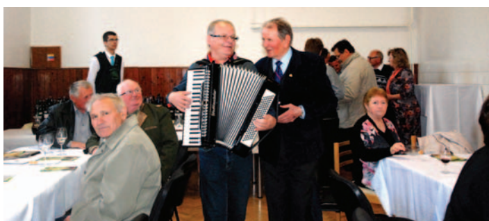
♦ Na záver nechýbala dobrá nálada, ktorú sa sanžil spestriť harmonikár.