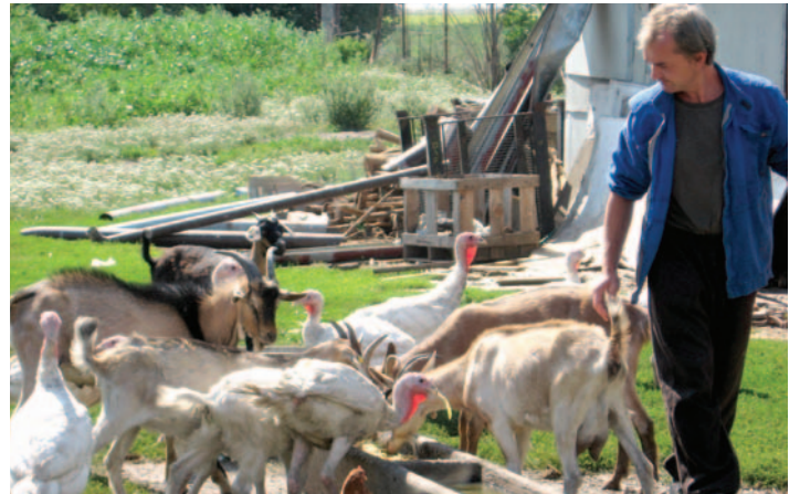
♦ Chovanci si vo dvore dochovávajú hydinu a v záhrade dopestujú potravinárske produkty