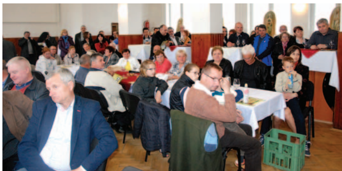
♦ Pohľad do sály na účastníkov podujatia.