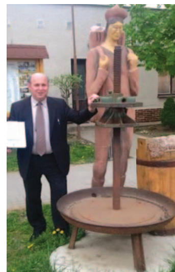
♦ Na snímke jeden z vlaňajších víťazov súťaže aj s ocenením pri Svätom Urbánkovi, patrónovi vinárov