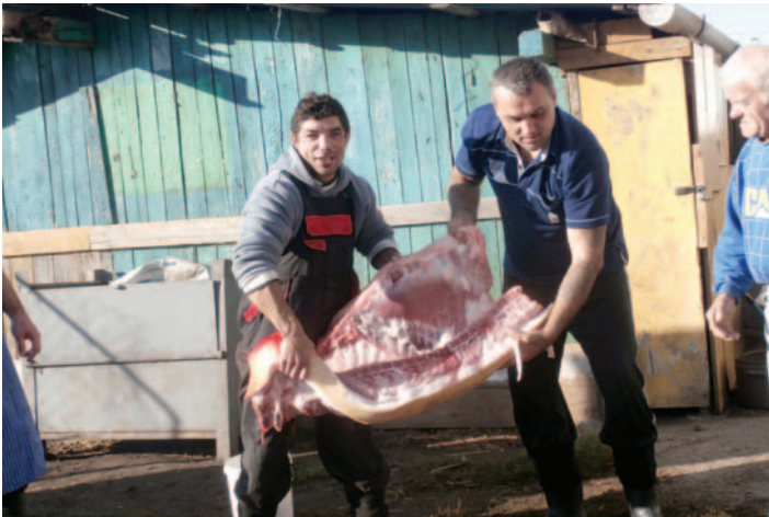
♦ Veľa potravín sa im dostane na stôl z vlastného chovu

Chovanci si prácou na hospodárskom dvore a v záhrade dochovávajú hydinu a dopestujú poľnohospodárske produkty na vlastnú potrebu. Chovajú kozy, ovce, prasiatko, sliepky, kačice, morky a králiky, čiže majú mäso, mlieko, vajcia. V záhrade si dopestujú zeleninu.