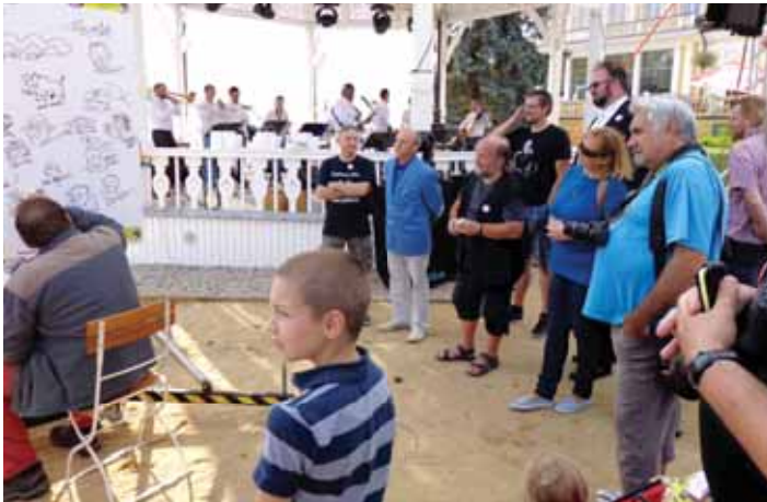
♦ Karikaturisti prezentovali svoju zručnosť aj individuálne pred zrakmi divákov