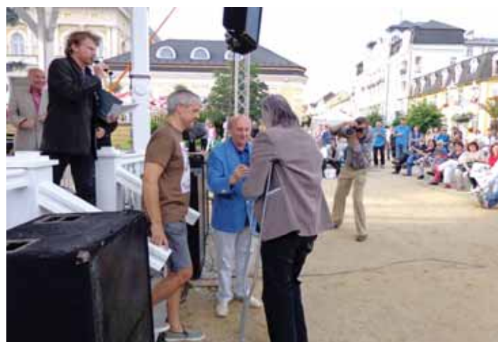
◆ Odovzdávanie cien sa uskutočnilo v strede kúpeľného mesta

mi hlasmi, pričom na hlasovaní sa ich zúčastnilo 1335. Hlavné ceny boli rozdelené do kategórií Vtip roka, Zlatý Tapír čitateľov (magazínu s týmto názvom), Zlatý prameň a Zlatý Tapír, za ktoré autori získali finančné odmeny v hodnote 30 tisíc